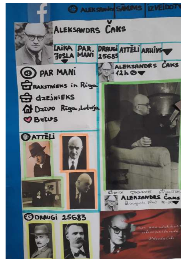
Ja Čaks dzīvotu mūsdienās...