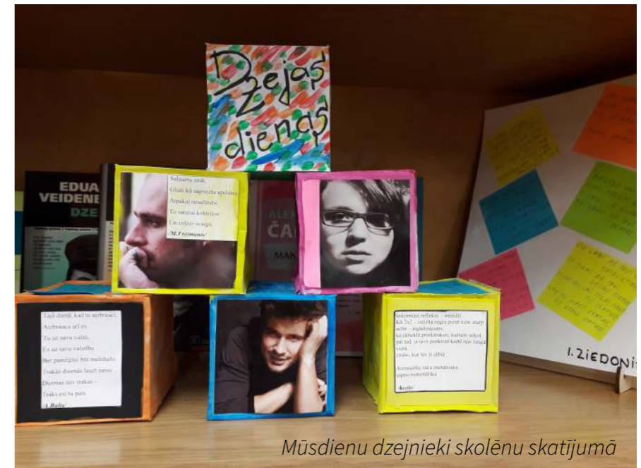
Mūsdienu dzejnieki skolēnu skatījumā