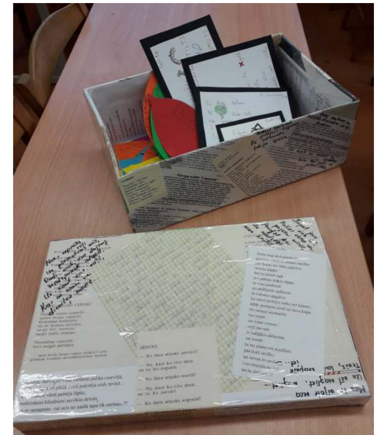
Skolēnu jaunrade turpmāk glabāsies izveidotajā dzejas kastē