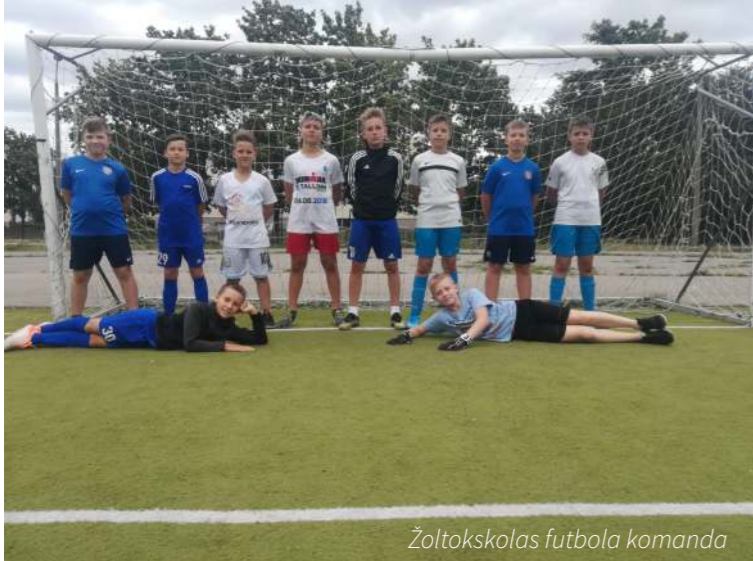
Žoltokas vidusskolas futbola komanda

11. septembrī Rīgas Sergeja Žoltoka vidusskolas futbola komanda 4. un 5. klašu konkurencē piedalījās futbola sacensībās Rīgas 93. vidusskolā. Šajā apakšgrupā piedalījās vēl trīs skolas: pati Rīgas 93. vidusskola, Rīgas 92. vidusskola un Rīgas 88. vidusskola. Spēle notika 2x8 min. Sacensības tiesāja divi kvalificēti futbola tiesneši.